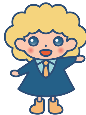
パートタイム・有期雇用労働法 キャラクター「パゆうちゃん」

電話相談を平日9時から17時まで受付していますが、受付時間外または相談予約については下記相談申込書によりFAXにてご送付ください。こちらからお電話をさせていただきます。